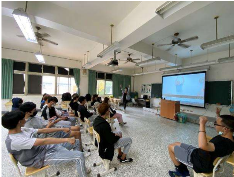
加強各項菸品危害認知及伸展運動課程